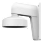
DS-1272ZJ-110 Настенный кронштейн