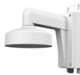
DS-1272ZJ-110B Настенный кронштейн