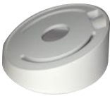
DS-1259ZJ Потолочное крепление